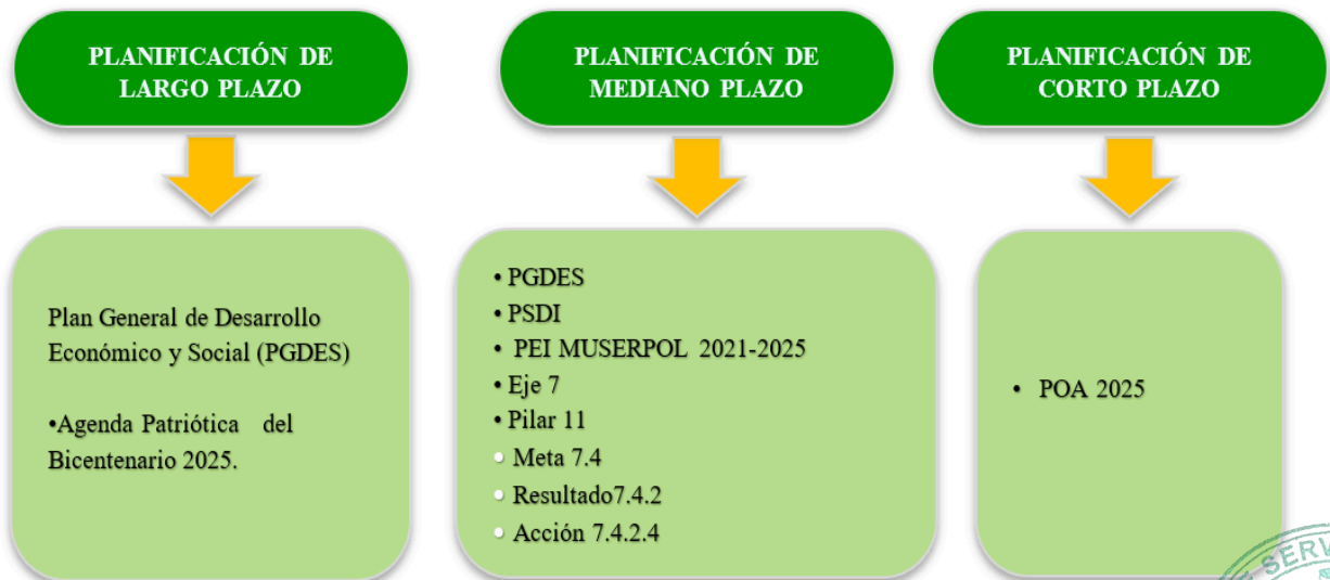
Ilustración 1. SPIE: Estructura y jerarquía de los planes

Fuente: Elaboración propia, en base a la ley N° 777 SPIE.